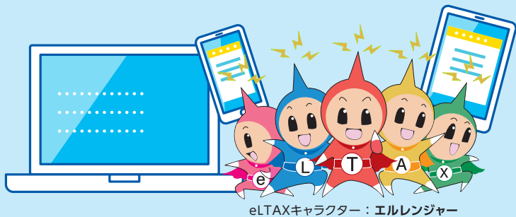
eLTAXキャラクター：エルレンジャー