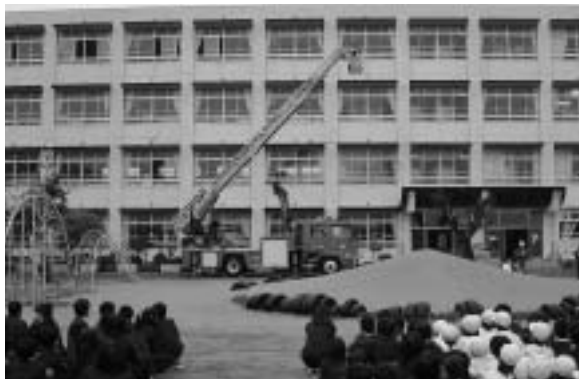
田原小学校での訓練風景

田原小・西中で避難訓練 2月28日(月)、田原小学校と福崎西中学校で、地震と火災を想定した避難訓練が行われました。 訓練の内容は、中播消防署はしご車による児童救出活動、町消防団によるけが人の搬出活動、放水活動などです。 児童・生徒は、きびきびした救出・消火活動を目の当たりにし、緊張した面持ちで真剣に訓練に参加しました。 (学校教育課)