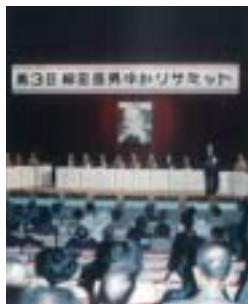
平成元年 第3回柳田國男ゆかりサミット (福崎町文化センター)