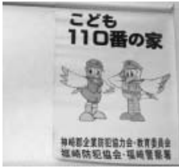
この表示旗が目印！