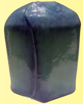
彫塑・工芸「サンゴの海」 藤原 正之(姫路市)