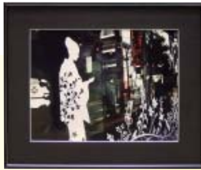
写真「白美人」 田中 淳子(加東市)