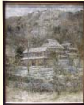
洋画「2011・雪」 足立 哲郎(朝来市)