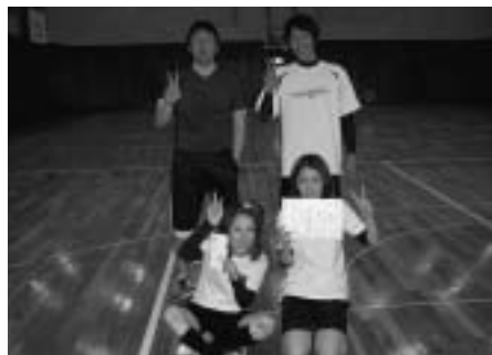
優勝「チーム85」のみなさん

優勝 チーム85 準優勝 T W O M I X 第3位 S E L F I S H VIP笑・