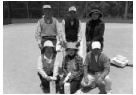
団体の部優勝「福崎GG協会板坂B」のみなさん