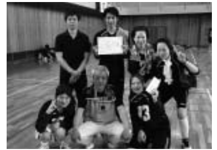
優勝した「V・I・P笑・」のみなさん

結果は次のとおり。 優勝 V・I・P笑・ 準優勝 SELFISH 第3位 555 第4位 チームとよみ (田原SC所属)