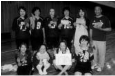
優勝した「V・I・P笑・」のみなさん