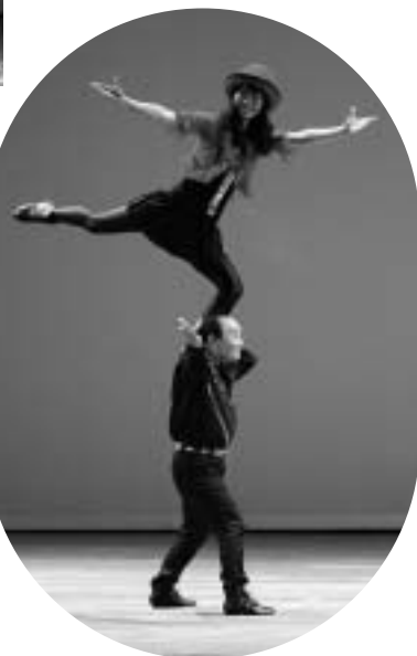
ザ・ラッキーさん