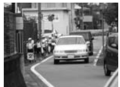
県道甘地福崎線の状況(福崎高校東踏切付近)