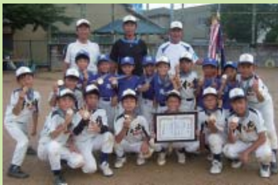
井ノ北・加治谷子ども会