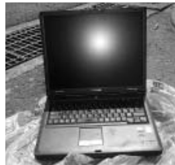
実際に持ち込まれたパソコン

パソコン、自動車部品、消火器(未使用)などの処理困難物が、くれさかクリーンセンターに持ち込まれるケースが多発しています。これらの物は持ち込みできませんので、次の適正な方法で処理してください。ごみステーションにも絶対に出さないでください。分解しても出せません。