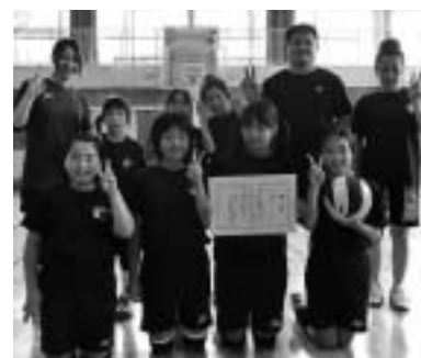
優勝した「たんぼぼクラブA」のみなさん