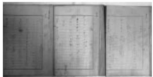
『播磨国風土記新考』の直筆原稿