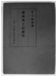
『播磨国風土記新考』