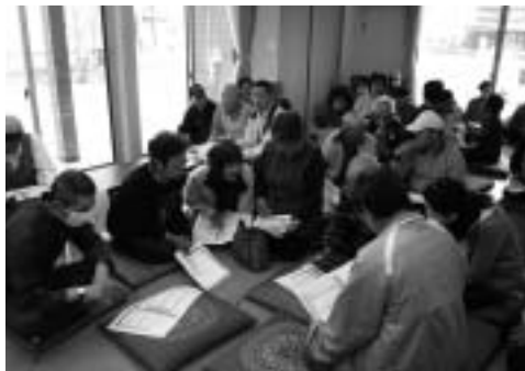
住宅入居者顔合わせのようす

います。今回の整備により、これまでの行政区が大きく変わります。そのため、地域のコミュニティを再構築していかねばならず、多くの住民が戸惑っています。 今回、新山下駅周辺地区の住宅で新たに入居された方との顔合わせがあるということで、お邪魔させていただきました。