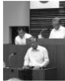
第456回定例会 (6月議会)

好きではありません。戦争のできるよう憲法を変えたり、ましてや条文を変えずに解釈を変えて戦争のできる日本になることも望んでいません。