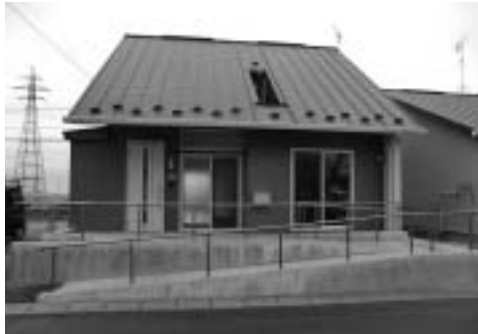
現在完成している災害公営住宅

震災で、町の中心部である2つの駅周辺を含め、7つの行政区が壊滅的な打撃を受けました。再建にあたり、町では、これらの地域を3つの市街地に集約し、機能的なまちづくりを進めようとしています。大きな課題が出てきて