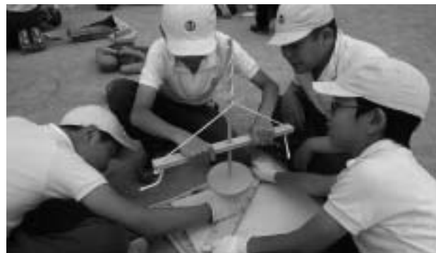
木と木をこすりあわせて まずは火おこし

「火を起こすのも、米を炊くのも、現在の自分たちよりも努力していたんだな。」「昔の人はいろいろな知恵を使ってくらしていたんだな。」「今の自分たちはとってもありがたいな。」と、自分たちの食生活を見つめ直すことができました。