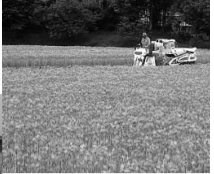
一面に色づいた麦畑は黄金のじゅうたんのようです