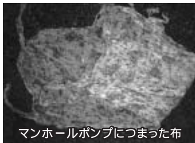
マンホールポンプにつまった布

下水道は、みなさんの生活環境や町の豊かな自然をよりよくするための大切な財産です。一人ひとりがルールを守り、正しく使いましょう。