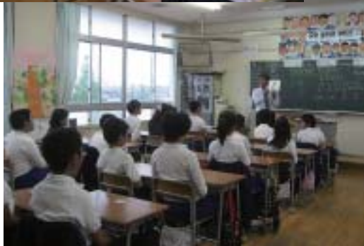
福崎小学校で福崎西中学校の先生が英語の授業