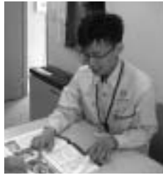
(宮城県山元町派遣)

本年度、福崎町からは宮城県山元町に職員を派遣しています。現地からの活動報告「復興支援レポート」をみなさんにご紹介します。