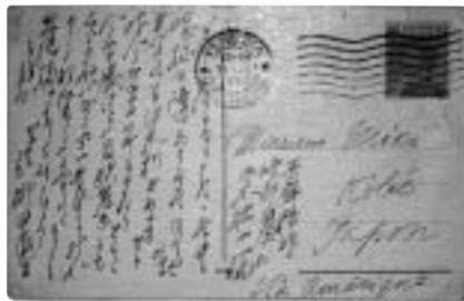
柳田國男から三木拙二への絵葉書(個人蔵)