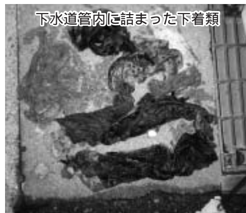
下水道管内に詰まった下着類

タオル、水に溶けない紙、髪の毛などが主な原因で下水道本管やマンホールポンプを詰まらせています。