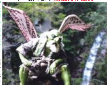
「天狗の森の妖翁」 稲村彰彦