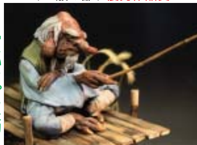
「じいちゃん天狗」 ホカリタケシ

第1回全国妖怪造形コンテストは、一般部門91作品ジュニア部門22作品の応募があり、厳正な審査の結果入選作品が決定しました。入選作品はもちむぎのやかたに展示する予定です。