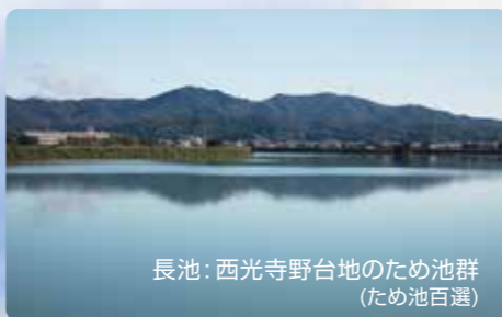
長池: 西光寺野台地のため池群 (ため池百選)