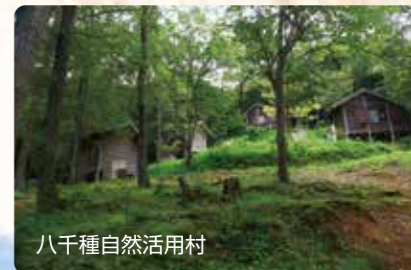
八千種自然活用村