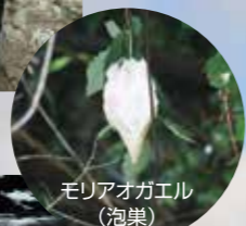
モリアオガエル (泡巣)