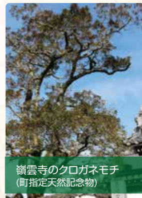
嶺雲寺のクロガネモチ (町指定天然記念物)