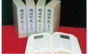
平成7年 福崎町史全四巻完結