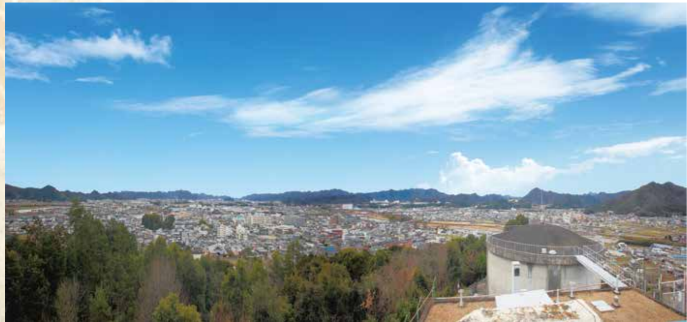
現在の辻川山からの眺望