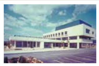
昭和50年 役場新庁舎完成