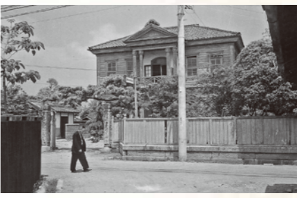
神崎郡団体事務所