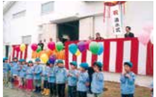
平成17年 福崎浄化センター通水式