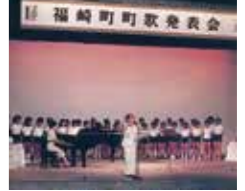
平成7年 福崎町町歌制定