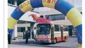
平成11年 巡回バス運行式