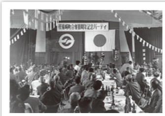
昭和41年 町制10周年記念式典