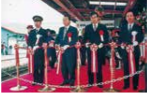
平成10年 播但線電化・高速化開業出発式