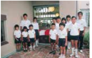
平成17年 福崎町立図書館開館式