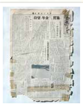
昭和34年 広報「ふくさき」第1号発行