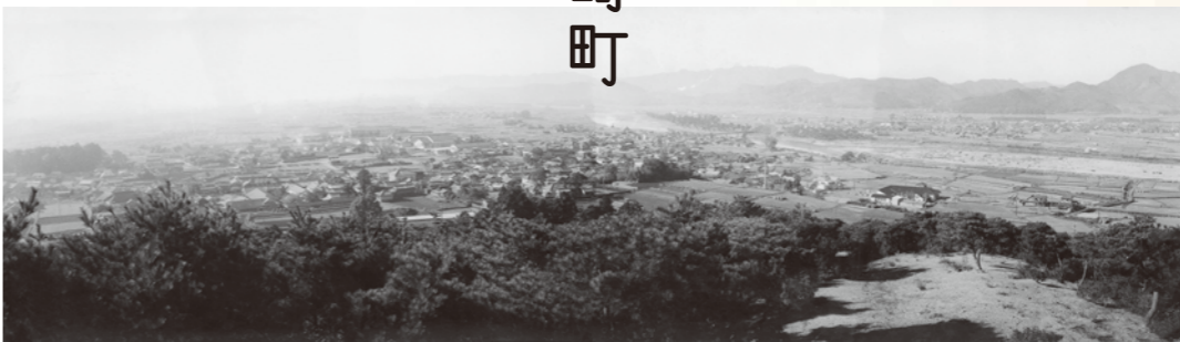
辻川山からの眺望