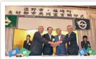
平成26年 若手県選野市と友好都市宣言