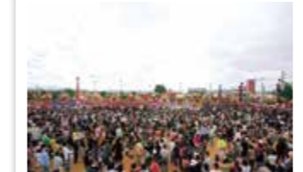
平成18年 ふくさき50 祭り屋台大集合