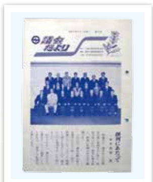
昭和57年 議会だより第1号