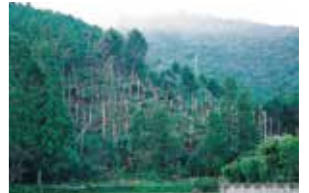
平成16年 台風23号による倒木