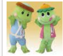
平成21年 フクちゃん・サキちゃん