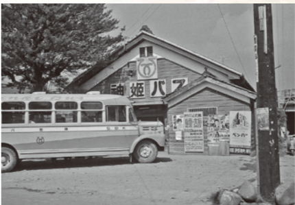
神姫バス福崎営業所