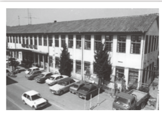
昭和40年 前福崎町庁舎