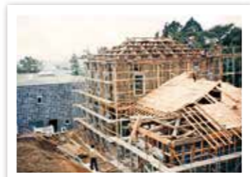
昭和57年 歴史民俗資料館建設