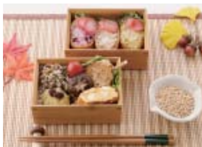
作品「女子が喜ぶお弁当」

もち麦入り稲荷 ずしをはじめ、野 菜、海藻、きのこ 等、女性の健康を 意識した食品の組 み合わせが高く評 価されました。