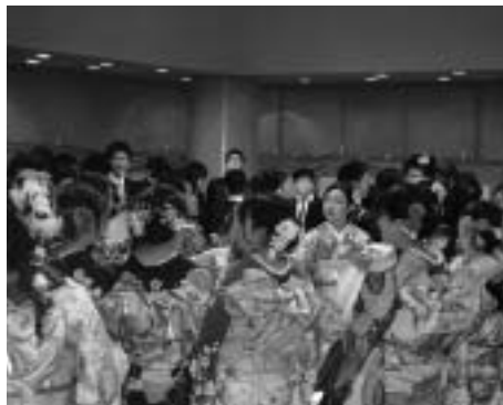
アトラクションのようす