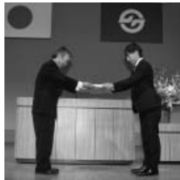
選挙管理委員会から記念品贈呈