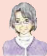
神戸医療福祉大学 北出先生の一言メモ