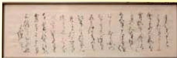
書「新古今集(月見れば...)千首」 田中 千津子(加西市)