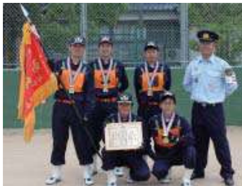
小型動力ポンプの部優勝 庄分団

6月23日、神崎小学校グラウンド(神河町)で「第7回神崎郡消防操法大会」が開催されました。 神崎郡の各町の大会を勝ち抜いた、小型動力ポンプの部6隊、自動車ポンプの部3隊の計9隊が熱戦を繰り広げました。福崎町からは、小型動力ポンプの部に庄分団と余田分団、自動車ポンプの部に西治分団が出場しました。