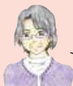
神戸医療福祉大学 北出先生の一言メモ