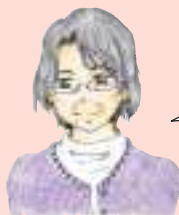
神戸医療福祉大学 北出先生の一言メモ