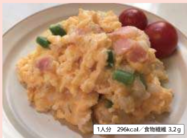
1人分 296kcal/食物繊維 3.2g