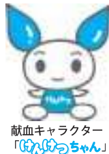
献血キャラクター 「はなはなちゃん」