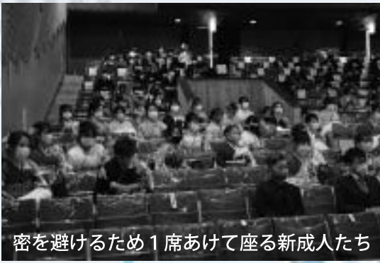
密を避けるため1席あけて座る新成人たち