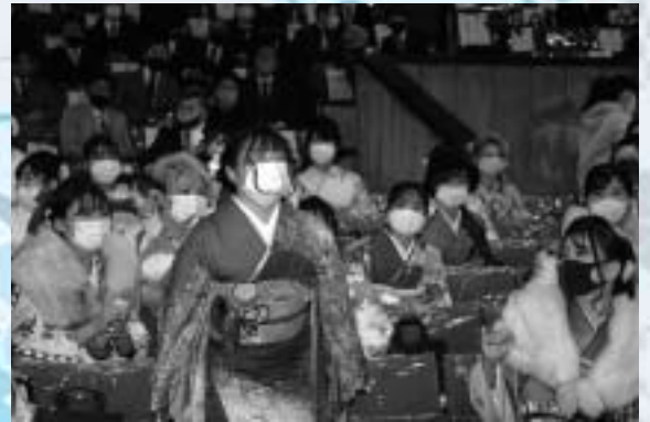
アトラクション（お楽しみ抽選会）のようす