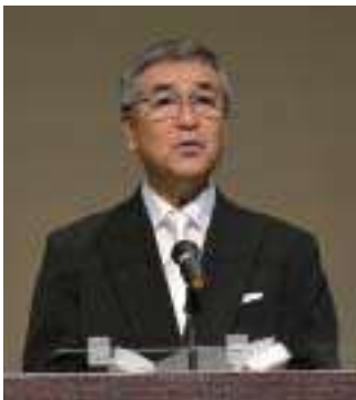
成人式で式辞を述べる町長

中止や延期をする市町もある中でしたが、福崎町は実施をしました。このことにはいろんな意見があると思いますが、いずれも正解だと考えています。ただ、実施にあたっては感染防止対策をしっかりと行い、この会場から決してクラスターを出さないという覚悟のうえで行ったものです。参加者が少なくなるのではと心配をしていたのですが、例年のおり多くの成人が参加してくれました。思い出に残る1日になったのではないかと喜んでいきます。