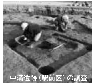
中溝遺跡(駅前区)の調査