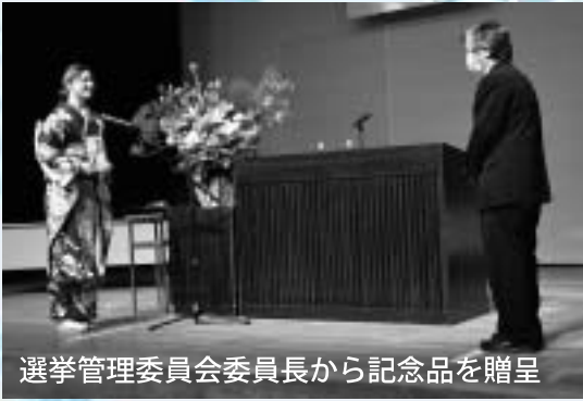
選挙管理委員会委員長から記念品を贈呈