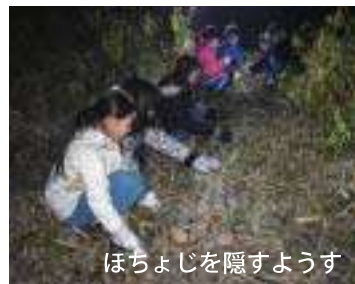
ほちよじを隠すようす