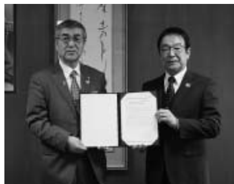
行政改革懇話会大井会長(右)から尾崎町長へ意見書を提出