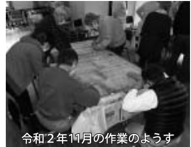
令和2年11月の作業のようす