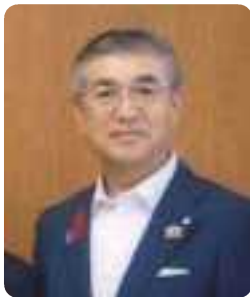
県知事への要望会にて

長が参加する斎藤兵庫県知事への要望会がありました。フリートークの時間が設けられ、