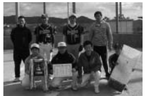
優勝した八千種SC(A)のみなさん