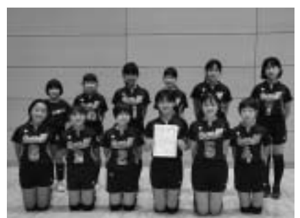
田原SCスポーツ少年団