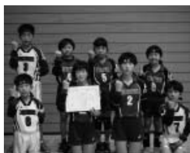
福崎Peach JVCスポーツ少年団