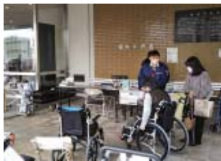
福祉用具展示のようす