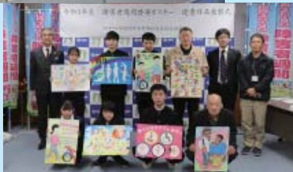
健康福祉課 町民福祉係（内線351、353）