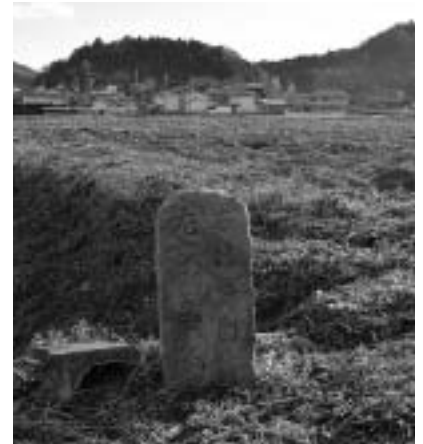
法華道の道標(小倉区)