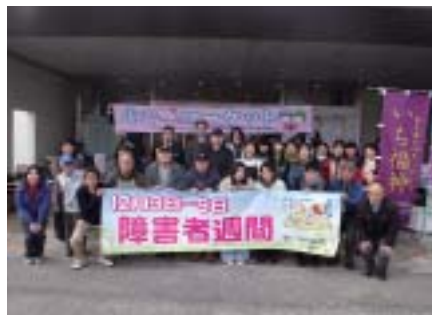
ふく咲マーケットスペシャル

令和3年度障害者週間実施イベントについて 12月3日(金)から9日(木)の障害者週間期間中、福祉用具の展示や神崎郡内等の就労継続支援事業所10か所のPRを兼ねた「ふく咲マーケットスペシャル」を開催しました。 今後も、地域共生社会の実現に向けた取組を実施していきます。