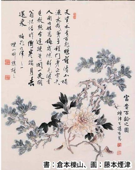
書：倉本樸山、画：藤本煙津