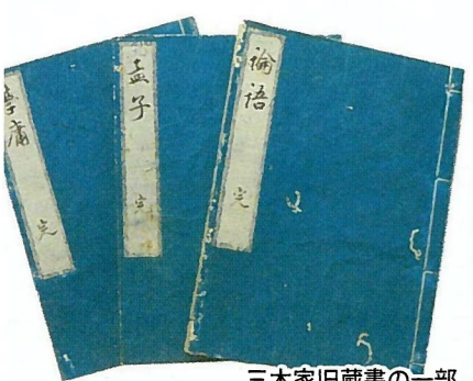
三木家旧蔵書の一部