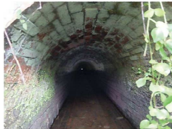
西光寺野疎水路の煉瓦トンネル

明治時代末の調査により、瀬加村の岡部川（現市川町）を水源とし、延長約8.8kmの水路（西光寺野疎水路）により、西光寺野のため池を築造することになりました。大正3年（1914）に水利工事、翌年に耕地整理が完成し、西光寺野の開発が完了しました。なお、これにより、近世の新田開発地の大部分が池として消滅しましたが、桜下池周辺の小字に「新開」の名前で名残をとどめています。