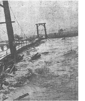
昭和38年の集中豪雨による水害（月見橋）

戦後は、戦時中の山林伐採のため、水害が相次ぎます。大型台風の襲来も多く、被害が拡大したことから、1950年代から植林や河川改修工事が進められ、防災対策が講じられてきました。