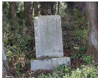
ビワクビ井堰記念碑

江戸時代中期以降、本町域においても数多くのため池が築造され、新田開発が進められました。また、寛政元年（1789）の大庄屋三木通庸による犬ヶ鼻の岩をくり抜いた水路の開削や、天保年間（1831～1845）から明治期のビワクビ疎水路の工事など、用水路の整備も進められました。なかでも、本町域での最も大掛かりな開発は、西光寺野の開発でした。