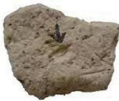
粃の痕跡のある土器片（宮山遺跡）

歴史民俗資料館には、1年の農作業（苗代、播種、荒起こし、代かき、苗取り、田植え、草取り、稲刈り、脱穀、俵しめ）を行うことができる多くの農具を所蔵しており、わたしたちの先祖が改良と工夫を重ねてきた米づくりの苦勞を知ることができます。