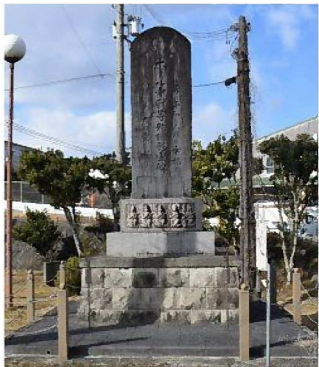
ポール中尉等殉職慰霊碑