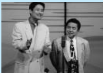
漫才 (立山センター・オーバー)