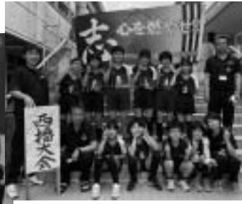
FVBふくさきスポーツ少年団