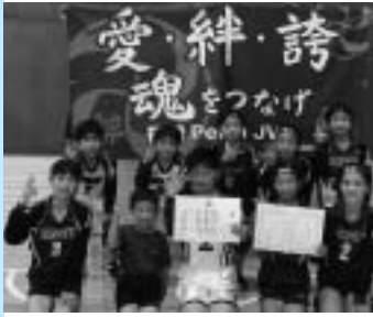
福岡PeachJVCスポーツ少年団