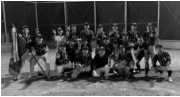
優勝 余田のみなさん