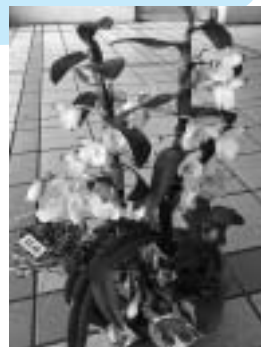
前回の寄せ植えです