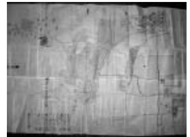
明治6年 中島村絵図

福崎町と神戸大学大学院人文学研究科地域連携センターは、中島区の皆さんと共同し、区で見つかった古い文書の保存・整理を行いました。