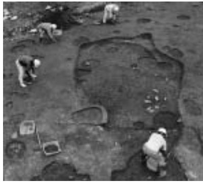
桜東畑遺跡の焼土坑

令和3年度は本発掘調査9件、試掘確認調査28件、大規模確認調査1件、立会調査3件を行いました。高岡・福田地区ほ場整備に伴う調査が主体でしたが、