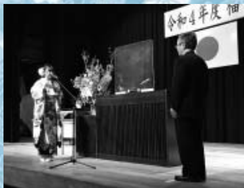
選挙管理委員会委員長代理から記念品を贈呈