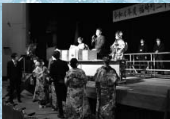
アトラクション（お楽しみ抽選会）のようす