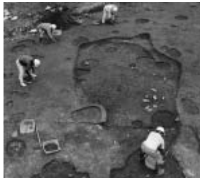
桜東畑遺跡の焼土坑

令和3年度は本発掘調査9件、試掘確認調査28件、大規模確認調査1件、立会調査3件を行いました。高岡・福田地区ほ場整備に伴う調査が主体でしたが、