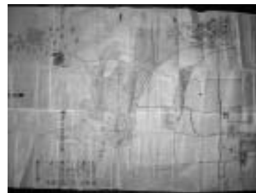
明治6年 中島村絵図

福崎町と神戸大学大学院人文学研究科地域連携センターは、中島区の皆さんと共同し、区で見つかった古い文書の保存・整理を行いました。