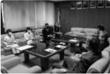
表敬訪問のようす

さまざまなスポーツや文化活動で頑張った子どもたちが私のところを訪れてくれ、活躍のようすを聞かせてくれることは非常にうれしく、自然と話もはずみます。このような若者が福崎町の将来を支えてくれる、と心強く思っています。