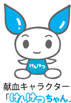
献血キャラクター 「ぴんぴんちゃん」