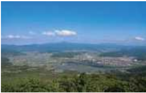
高清水展望台からの市街地全景

境を生かした農林畜産業を基幹産業とし、水稲を中心に、野菜やホップ、花などの農産物と畜産を組み合わせた複合経営がされており、日本一の乗用馬生産地として知られております。