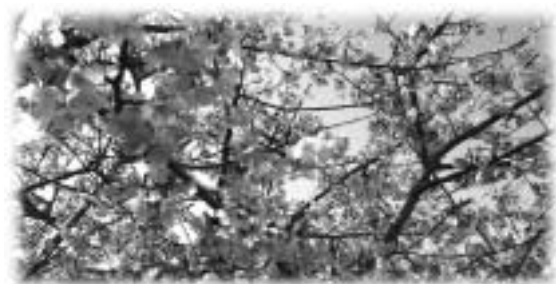
福崎浄化センター東側・さるびあ公園の河津桜