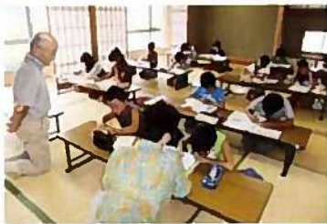
八千種小学校区 八千種研修センター