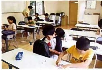
高岡小学校区 地域交流広場