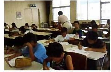
田原小学校区 サルビア会館