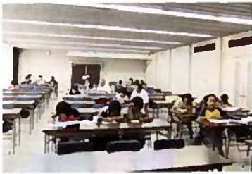
福崎小学校区 文化センター

今年度も、夏休みの勉強対策として、小学校高学年（4・5・6年生）を対象に8月に各地区5日ずつの“自習室”を提供しました。課題となっていた4地区での開催が、高岡小学校区地域交流広場推進委員会のご協力により実現できました。自宅から近くの会場で行われるサマースクールには、朝早くから子どもたちが集まり、涼しい会場でボランティアの先生方に親切ていねいに指導していただきながら、熱心に勉強に取り組みました。