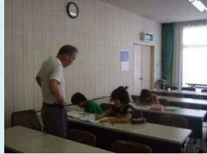
田原小校区 サルビア会館