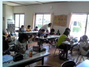
高岡小校区 県民交流広場