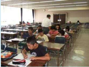
福崎小校区 文化センター