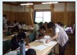
八千種小校区 県民交流広場

今年度も夏休みの学習対策として、小学校高学年(4・5・6年生)を対象に、各校区ごとに8月に5日ずつの自習室“サマースクール”を行いました。高岡・八千種校区では県民交流広場を利用させていただき、自宅から近く環境の整った場所で、ボランティアの先生方に親切に指導していただきながら、熱心に学習に取り組むことができました。ボランティア先生方、ご協力本当にありがとうございました！