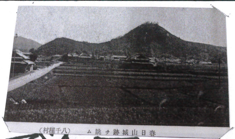
(村種千八) ム眺ヲ跡城山日春

ぼくは、お城が好きで全国のお城 に行っています。ぼくは、福崎町には お城がないと思っていました。