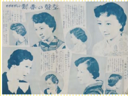
パーマのカタログ