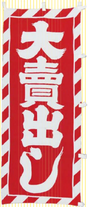
大売出しのぼり旗