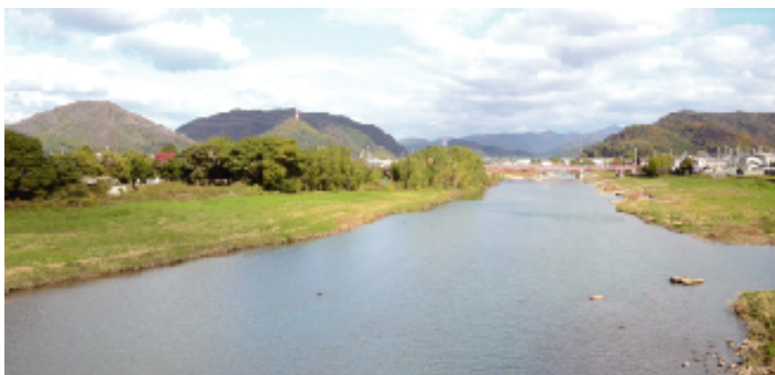
福崎大橋からの眺め（清流市川と神前山）