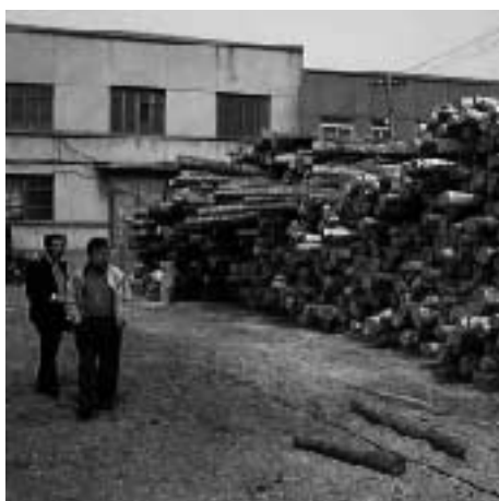
積み上げられた木材（広葉樹：雑木）中国