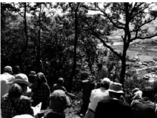
神前山山頂での風土記解説

本稿は、二〇一二年一月一日に、福崎町立神崎郡歴史民俗資料館連続講座④での講演「ふるさとの地名が語る古代の神崎郡」井上通泰の『播磨国風土記研究』をもとにしたものです。調査に際してご教示を賜った同館と柳田國男・松岡家記念館の学芸員の皆様にお礼申し上げます。