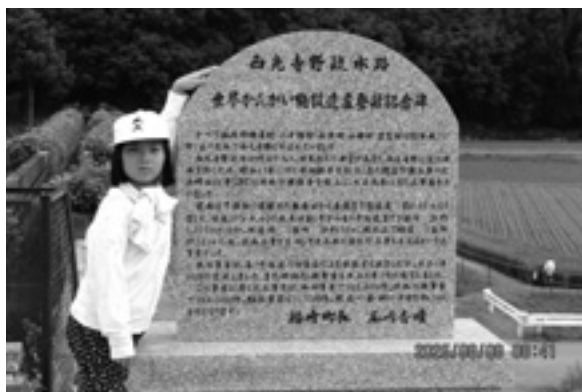
令和6年9月3日 世界かんがい施設遺産登録