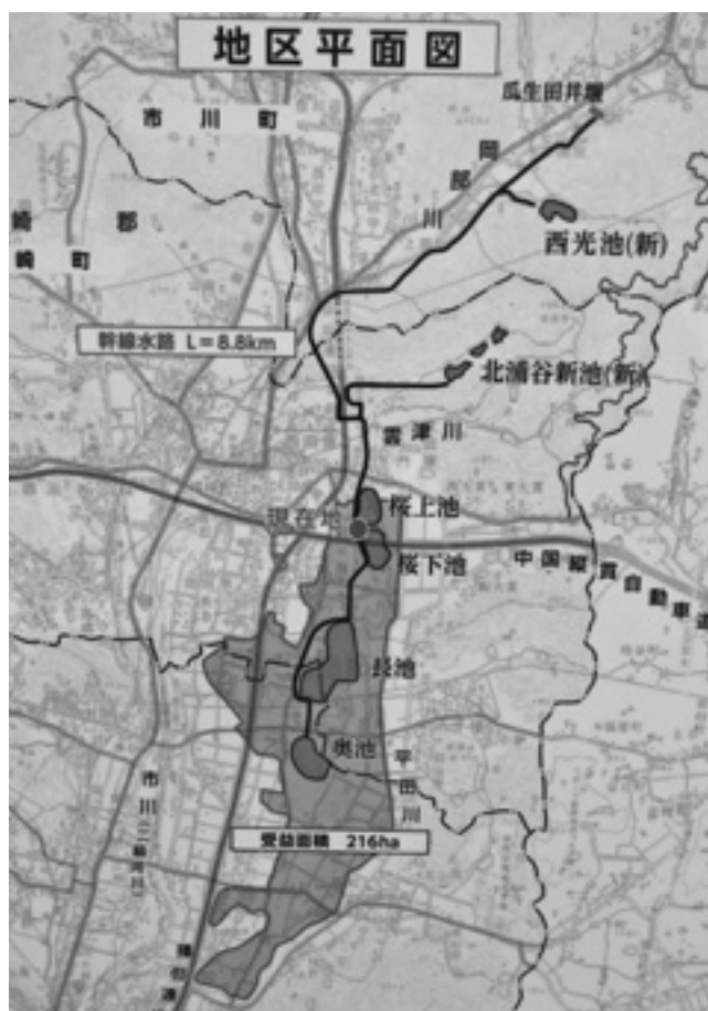
西光寺野疏水路図 (流域面積)