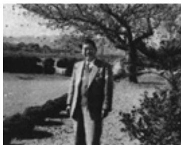
鼓笛隊生みの親、山口校長先生

指き、大太鼓、中太鼓、小太鼓シンバル、ベルリラ、スペリオパイプがあり、5・6年生で一組、3・4年生で一組の二組で構成されました。