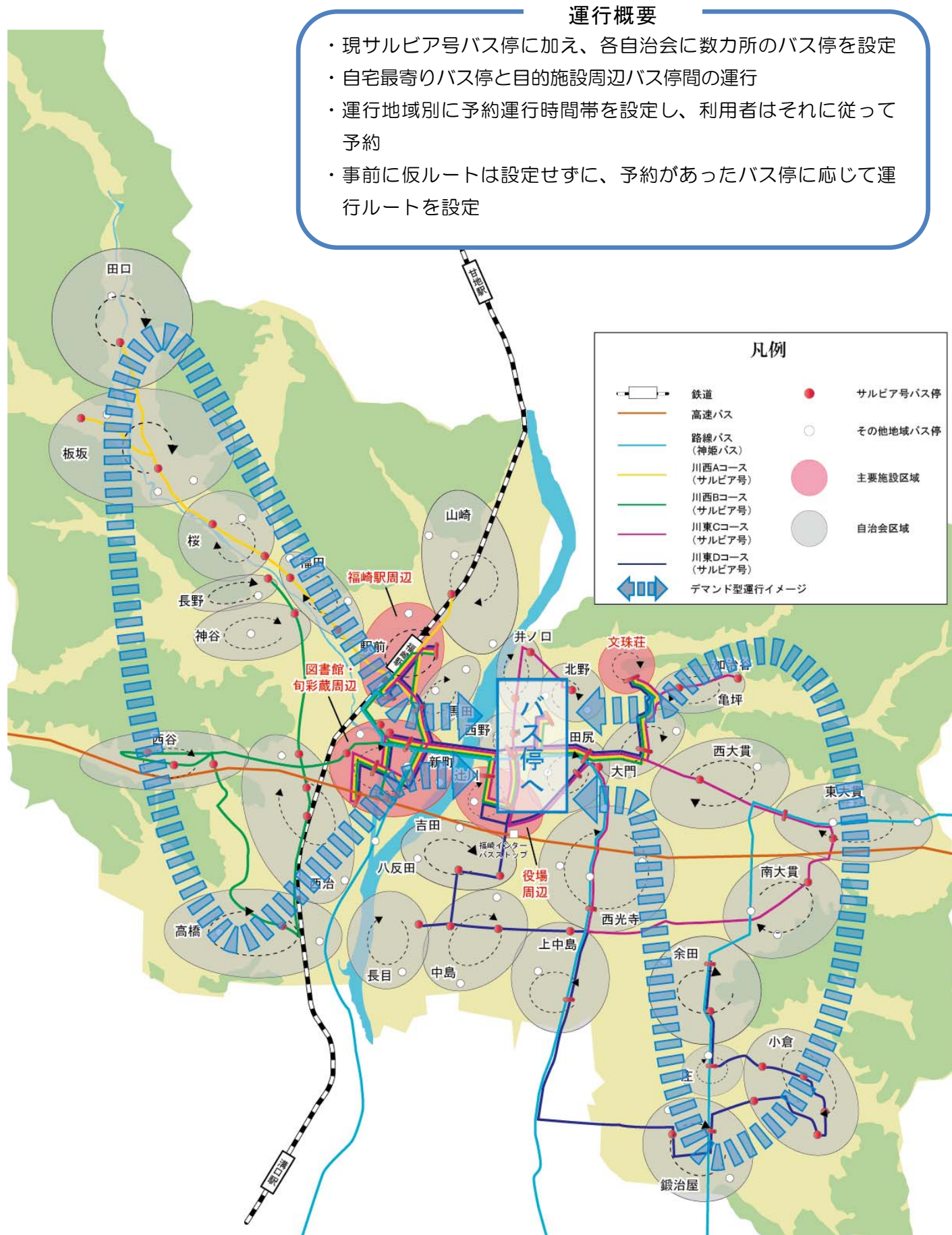
例3：バス停間フルデマンド型