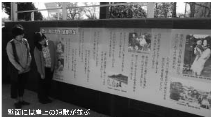
壁面には岸上の短歌が並ぶ