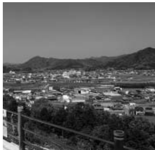
「望郷の丘」からの眺望