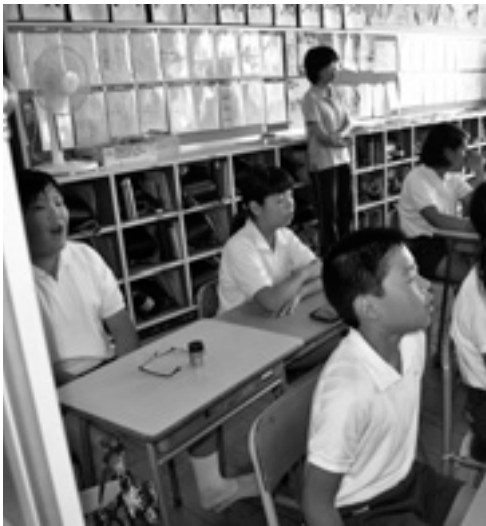
夏の授業の様子（八千種小学校）

問 住民にとって家族全員の住みやすさ、暮らしやすさが、定住・移住を考えると、重要な観点だ。近年の福崎町の夏の猛暑を考えると、小・中学校の普通教室にエアコンの設置が必要では