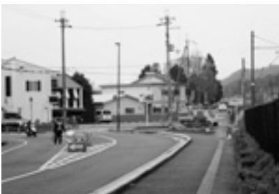
福崎駅南北で工事中