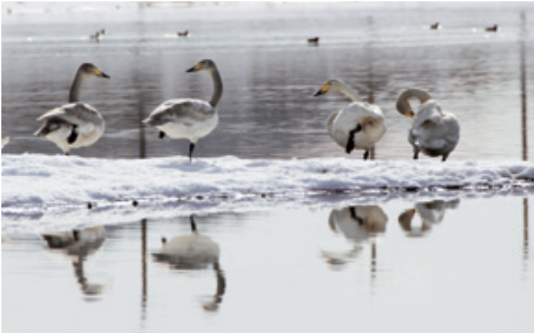
長池で羽を休めるオオハクチョウ

また、長池ではオオハクチョウの飛来も確認されました。近年は越冬のため毎年飛来しているようで、冬の風物詩となっています。(1月16日撮影)