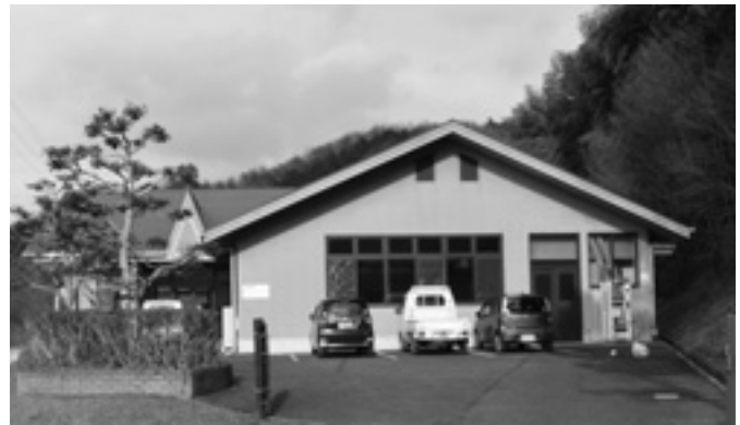
6次産業化の拠点となる春日ふれあい会館

企画財政課長 1事業でも交付の対象となるよう、積極的に国に申請し、補正予算を計上しています。