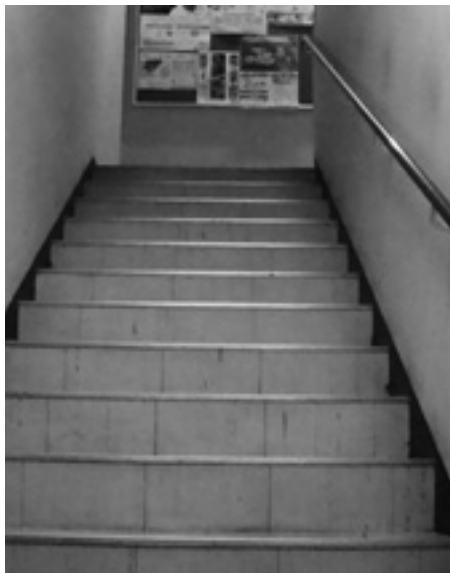
福岡市庁舎の階段

問 築41年を経過した庁舎を今後も利用していくのなら、エレベーターの設置、スロープの取付、障害者用のトイレ改修、窓口業務の対応等バリアフリー化を求める。 総務課長 現在の建物はバリアフリー化を想定した建物でないため、すべての改修工事は厳しい状況ですが、利用者に不便をおかけしないよう少しずつ改修工事を進めています。