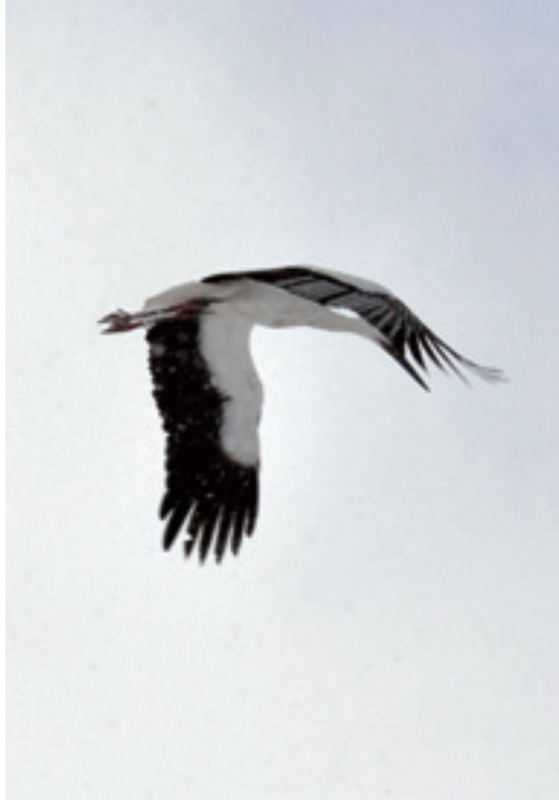
八千種を飛翔するコウノトリ