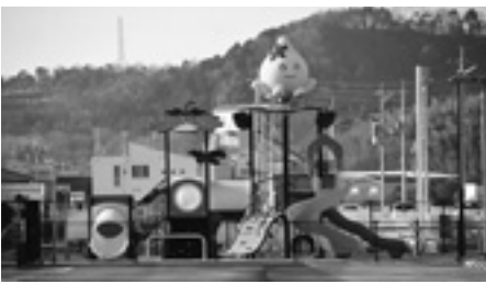
さるびあドーム遊具