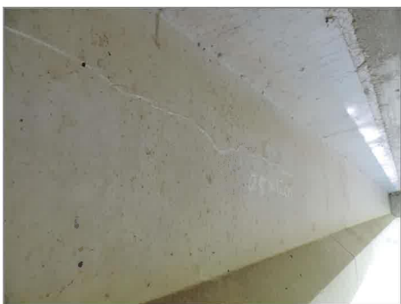
コンクリートにひびわれが見られます