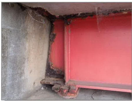
鋼桁に腐食が見られます