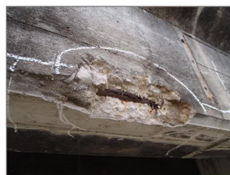
コンクリートに剥離・鉄筋露出が見られ