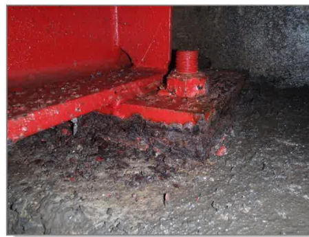
支承に腐食が見られます