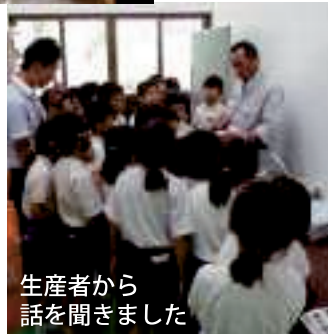
生産者から話を聞きました

植え付けから収穫、食するまでの一連の体験を通じて農作業の楽しさや苦労などを学び、地域の食や農業に興味をもち、特産品等に対する関心を深める機会となるよう取り組んでいます。