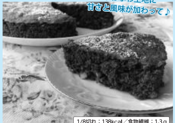
1/8切れ：138kcal / 食物繊維：1.3g