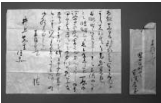
井上通泰宛高浜虚子書簡 （年代未詳12月11日） 柳田國男・松岡家記念館蔵