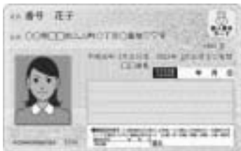
(みほん) マイナンバーカード

サービスを受けるためには、利用者証明用電子証明書が搭載されたマイナンバーカードが必要です。通知カードや住民基本台帳カード、印鑑登録証などでは利用できませんのでご注意ください。