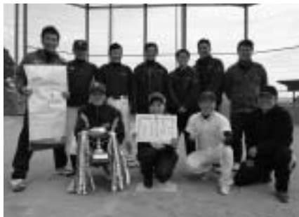
八千種スポーツクラブのみなさん

11月17日、第1グラウンドで「第61回地域職域親善ソフトボール競技大会」が開催されました。結果は次のとおり。 優勝 八千種スポーツクラブ 準優勝 余田