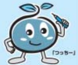
農林業センサス マスコットキャラクター