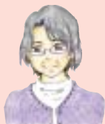
神戸医療福祉大学 北出先生の一言メモ